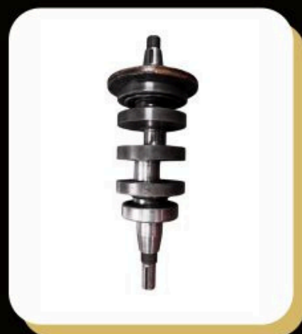
↑ Crank Shaft