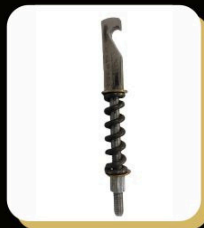
↑ J Hooks