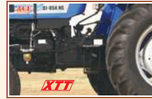
हेवी ड्यूटी XTT ट्रांसमिशन