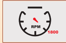
1800 आर पी एम - अधिक टार्क, इंजन की कम घिसावट