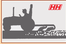
स्वचलित डैपथ व ड्राप्ट कंट्रोल लाईव हाईड्रॉलक्स मिक्स मोड के साथ