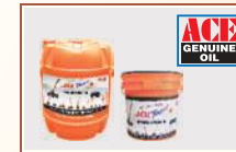
ACE Cost Effective Genuine Oil