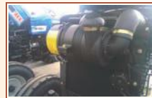
Dry Type Air Cleaner