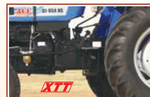
Heavy Duty XTT Transmission