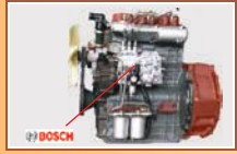
3 सिलिण्डर का शक्तिशाली इंजन