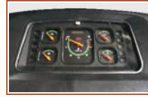
आकर्षक मीटर कंसोल