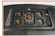
Attractive Meter Console