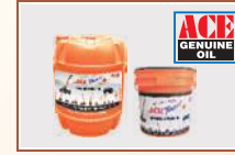
ACE किरफायती जैनुअन ऑयल