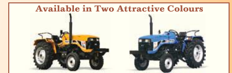
Available in Two Attractive Colours