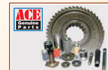
ACE Cost effective Genuine Parts