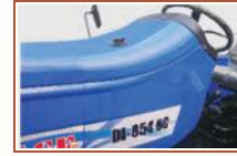
फ्यूल टैंक - 55 लीटर