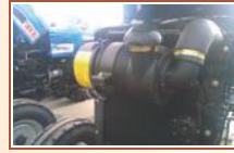
ड्राई टाईप एयर क्लीनर