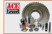
ACE किरफायती जैनुअन पार्ट्स