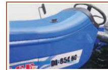
Fuel Tank - 55 Liter