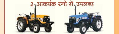
2 आकर्षक रंगों में उपलब्ध