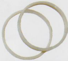
Glass Filled Nylon Performs perfectly for a long time in sandy bores.