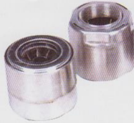
Grade SS-304 Bowl with projected welding for better pump efficiency.