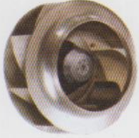
Impeller SS-304 SM impeller 15 meters per stage (with projected welding) for better pump efficiency.

मेसकोट पम्पस् के भारत भर में फैले हुए नेटवर्क में ६०० से भी ज्यादा विक्रेता हैं। परिणाम स्वरूप, आप मेसकोट पम्प कहीं भी आसानी से अधिकृत विक्रेता से प्राप्त कर सकते हैं। आपको बेहतरीन बिक्री-उपरांत सेवा देने के लिए देश भर में कई सर्विस सेंटर और कोर्पोरेट ब्रान्च ऑफिस भी उपलब्ध हैं।