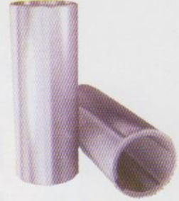
Sleeve SS-410 pump sleeve with hard Chrome to reduce the friction and can withstand wear resistance against Sand.