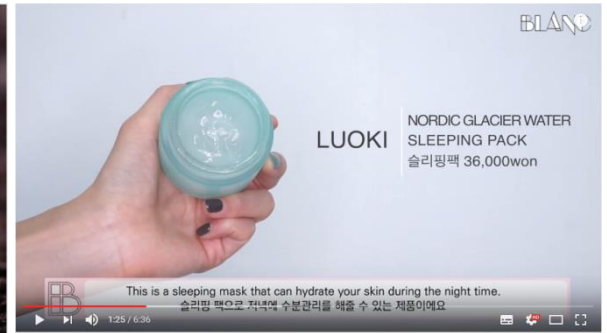
[ENG]이른 연말정산 그녀의 애정템(스킨케어, 립, 헤어제품) Early Yearly Favorites(skincare, lip, hair)