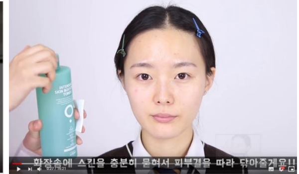
선배...내꺼하자!!! #간알골 #완정정복 #성형메이크업 #범메이크업 | [하코냥/Hakonyang]