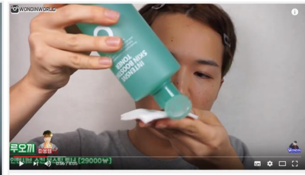
2017 S/S 컬러로 그리너리의 메이크업을 해 봤다! Greenery Makeup | 원 단