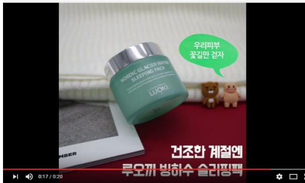
오끼] 라이언과 지방이의 겨울피부 지키기!