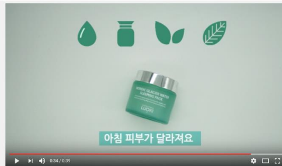
[루오끼] 어떤 성분이 들어 있을까~?