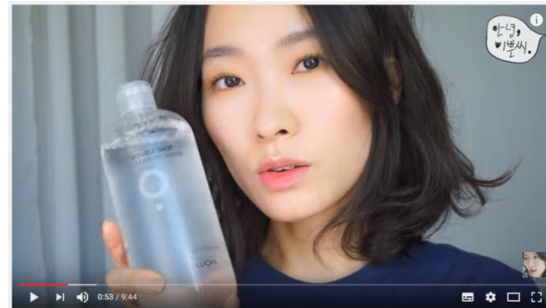
ENG. 민감 여드름 & 속건조 잡는 스킨케어 루틴 | Acne, Sensitive Skincare Routine | 안녕이쁜씨