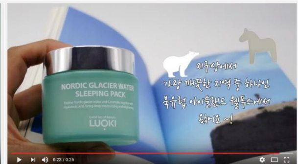
[루오끼] 루오끼 슬리핑팩의 빙하수는 어디에서 왔을까요~?