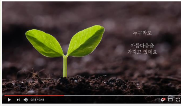
[루오끼] 아름다움으로의 열쇠, Lucid Key to beauty, LUOKI