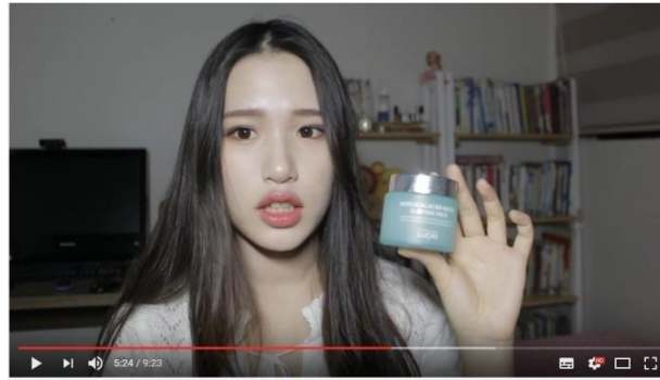
10대 여드름 피부 극복 비법과 트러블 피부를 위한 제품 추천 :)