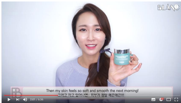
[ENG]이른 연말정산 그녀의 애정템(스킨케어, 립, 헤어제품) Early Yearly Favorites(skincare, lip, hair)